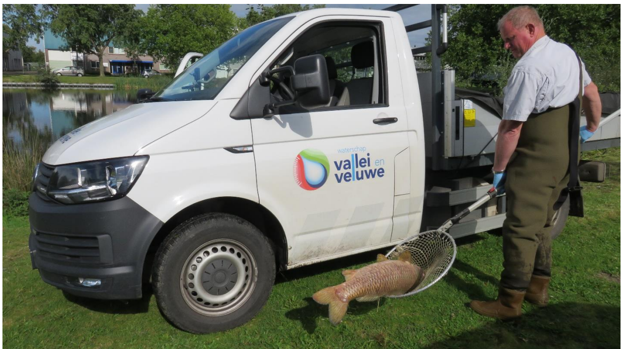
Dode karper bij de vijver in de Isselt.

In de wateren op het industrieterrein en de Keerkring zijn specifiek karpers gestorven door een niet duidelijke oorzaak. Het vermoeden is dat de dieren zijn getroffen door een karpervirus of dat de vissen zijn gestorven door ouderdom.