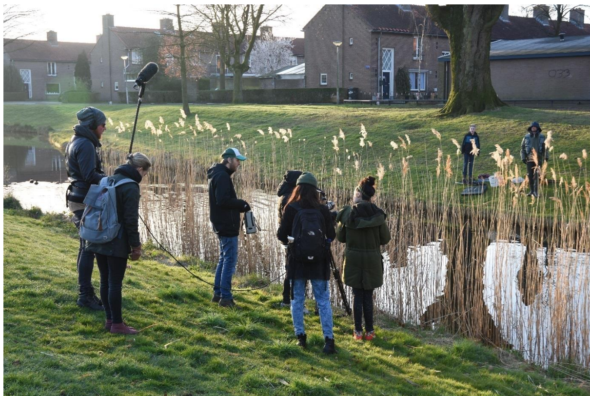
Opnames voor Nickelodeon in het Soesterkwartier.

Voor een uitgebreide uitleg over de sportvisserijtypen wordt verwezen naar het Bijlagenrapport.