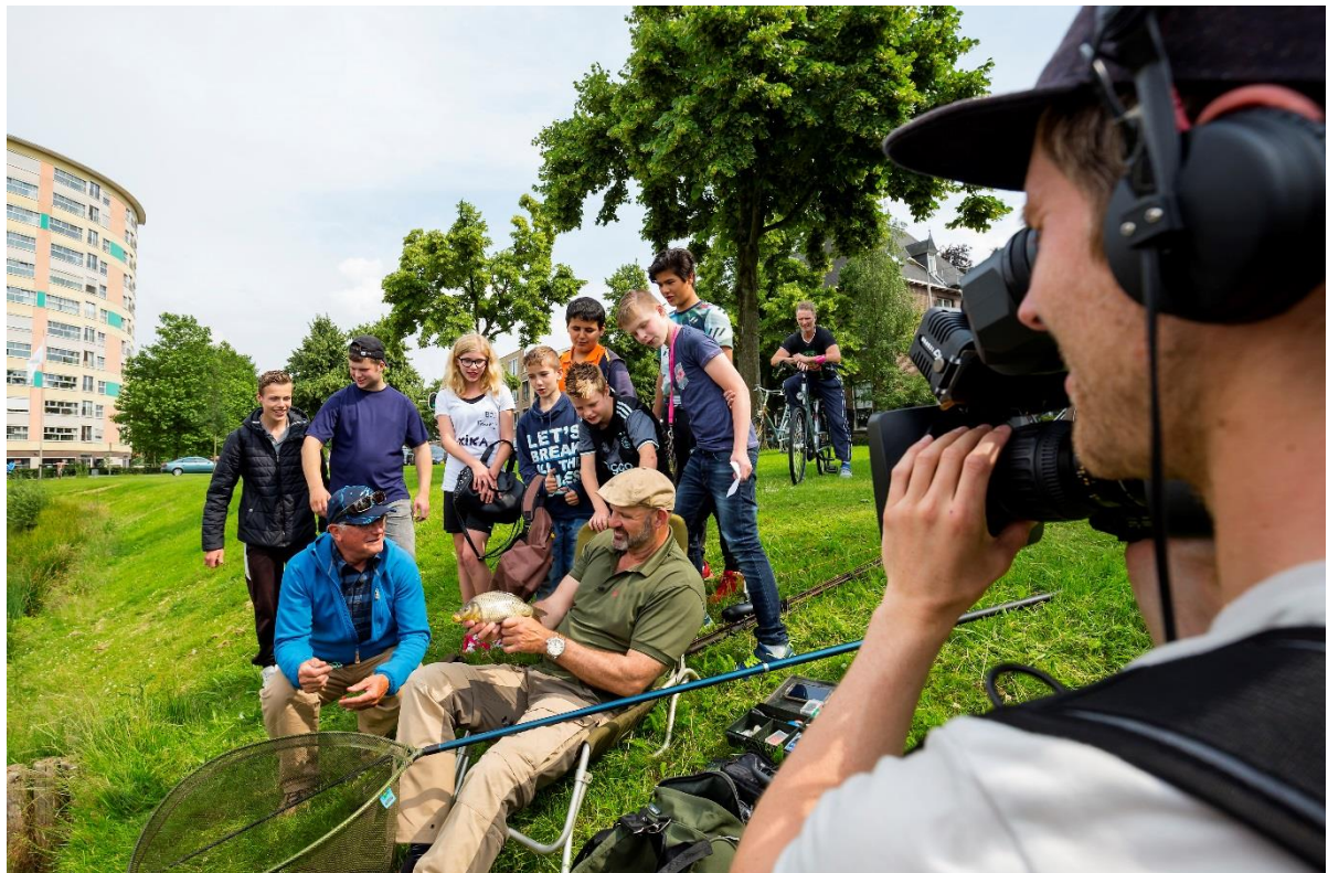
Opnames visTV bij de vijver aan de Noordewierweg.