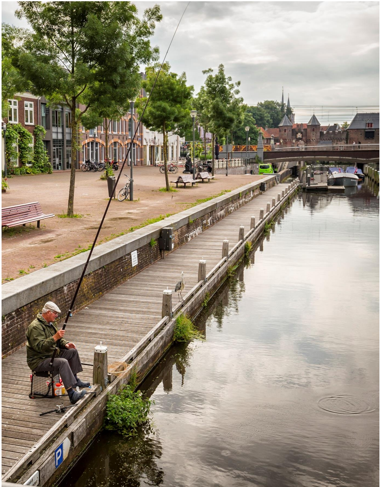
Sportvisser langs de Eem in Amersfoort.