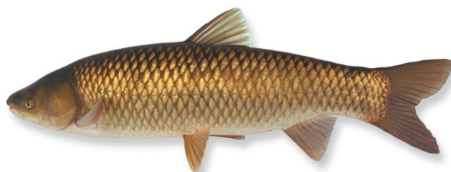
Graskarper is een aantrekkelijk alternatief voor het desastreuze maaien van waterplanten.

Actief (gras)karperbeheer zou een aantrekkelijk alternatief kunnen zijn. Graag zou HSVA samen met de gemeente in een aantal geselecteerde wateren willen experimenteren met het uitzetten van graskarper.