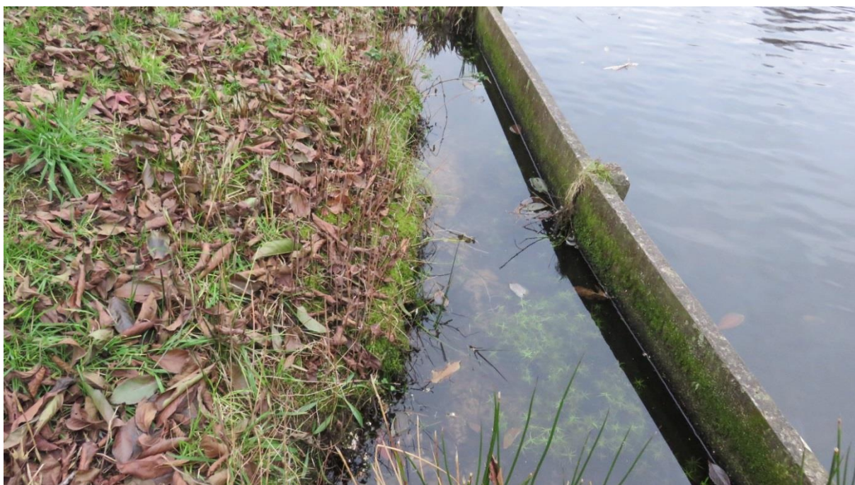
Afkalvende oever achter de beschoeiing in Calveen, langs de Astronaut.