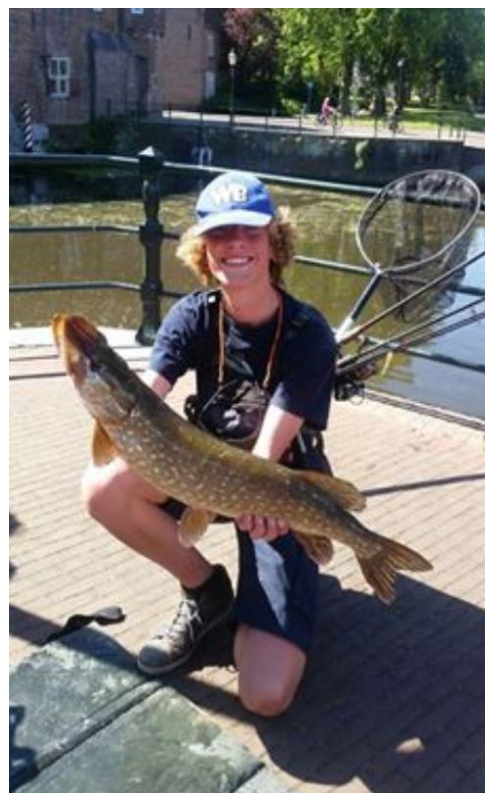
Een flinke snoek gevangen bij de Koppelpoort.