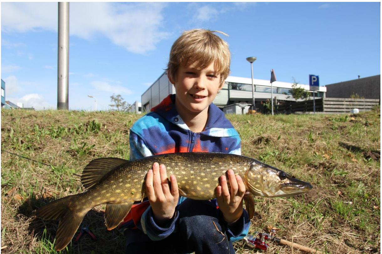
Snoek gevangen in Calveen.

De keuze van deze wateren kan in samenspraak met de gemeente plaatsvinden.